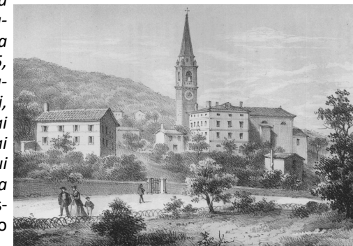
Disegno di Teolo nel 1863 a cura di Andrea Gloria

Un esempio di descrizione " L'arcipretale di Teolo titolata a Santa Giustina si fa molto antica, ricostruita nel 1310 e nuovamente edificata dappoi. Era pieve delle chiese di Montemerlo, Villa di Teolo, Zovon, Castelnuovo, Cortelà e Carbonara. Oggi delle prime due. Ha vestusto campanile e grandioso altare nella cappella maggiore con tela raffigurante l'Assunta e il battesimo di Santa Giustina, bell'opera attribuita al Campagnola. Vi si festeggia il dì 21 novembre a memoria del colera del 1836 e del 1855, dal quale fu indenne il villaggio. Il villaggio è abbondoso di frutteti, ciliegi, fichi, castagni e massime dell'uva d'oro dai biondi grappoli e della marsemina dai neri grappoli, ambo squisitissime, le cui viti sono tirate a pancate, a festoni, a filari, a pergola e ad albereto. " Nei prossimi bollettini altre curiosità da questo testo.